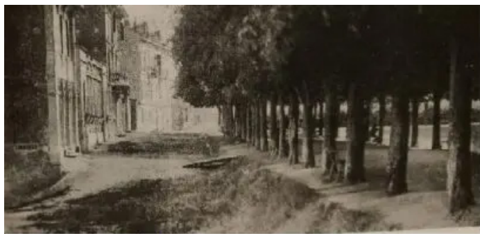
Viale del Diamante