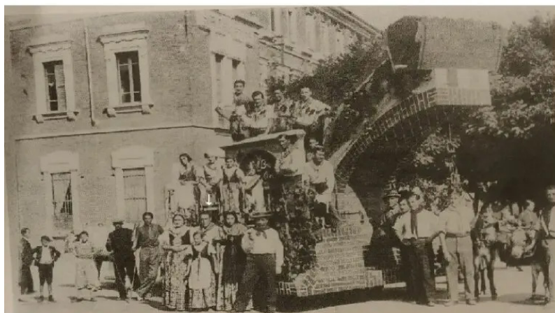
Settembre 1934. La festa dell'uva, angolo via Camurati e viale Galimberti di oggi

Tra i vari divertimenti, non manca il peccaminoso, spesso con effetti comici. All'epoca si raccontava, in modo caricaturale, che un anno arrivò un fortunato e ingannevole barconone che concedeva per un soldo la vista della "bella Virginia al bagno", e i nostri antenati maschi, che sussultavano già solo alla vista di una caviglia femminile, entrarono in gran numero, convinti di potere avere una visione erotizzante, ma si trovarono di fronte a un sigaro "Virginia" immerso in un vaso d'acqua. Quasi tutti non fiatarono all'uscita per non essere presi in giro e non pochi descrissero il contrario della realtà vista per coinvolgerne beffardamente gli altri pavoni, con grandi risate.